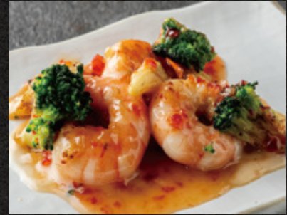
Grilled Shrimp & Mayonnaise 特選エビマヨ ¥1,780