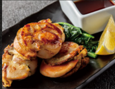
Grilled Scallops 帆立の鉄板焼 ¥1,780