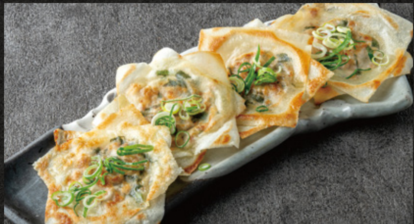
Crispy Cheese & Chicken Gyoza パリパリチーズチキン餃子 ¥1,450