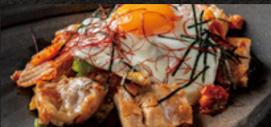
Grilled Chicken & kimchi 鶏キムチ炒め ¥1,280