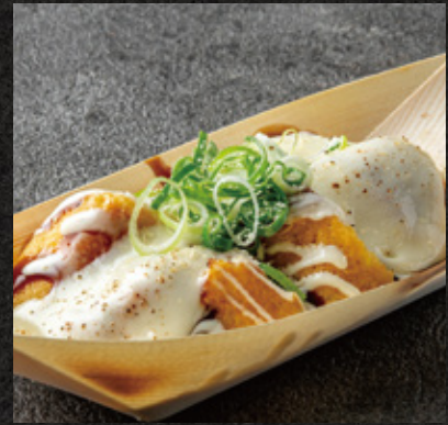
CHIBO original Teppan Takoyaki & Cheese 千房オリジナルチーズたこ焼 ¥1,250

Octopus, Egg, Red ginger, Green Chili タコ、たまご、紅生姜、青唐辛子