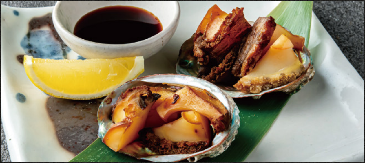
Abalone Steak あわびステーキ ¥4,500