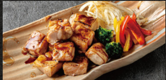
Teriyaki Chicken Steak (200g) ジューシー照り焼きチキンステーキ(200g) ¥2,680