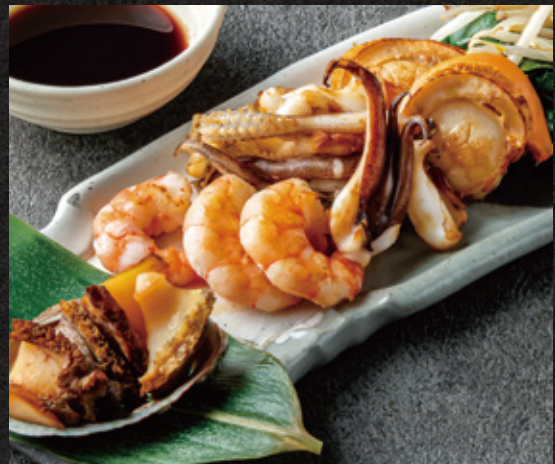
Special Assorted Seafood Platter ¥5,280 スペシャル海鮮盛り