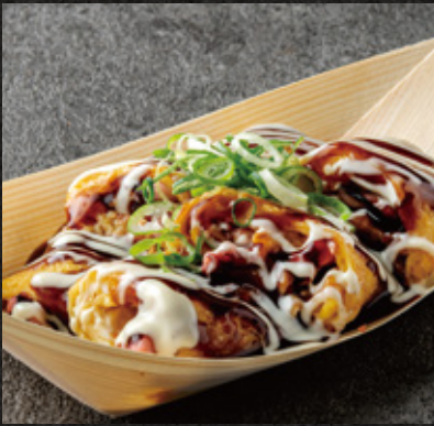
CHIBO original Teppan Takoyaki 千房オリジナルたこ焼 ¥980