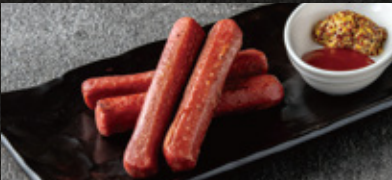
Sausage ソーセージ鉄板焼 ¥980