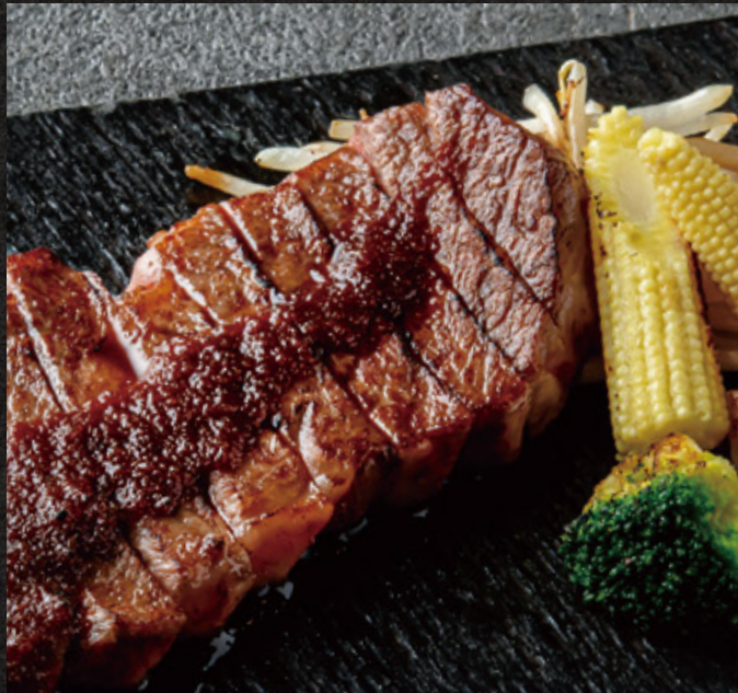
Wagyu Steak (150g) ¥8,200 和牛ステーキ(150g)