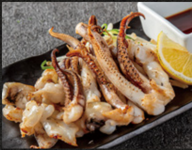
Grilled Squid Leg's ゲン鉄板焼 ¥1,150