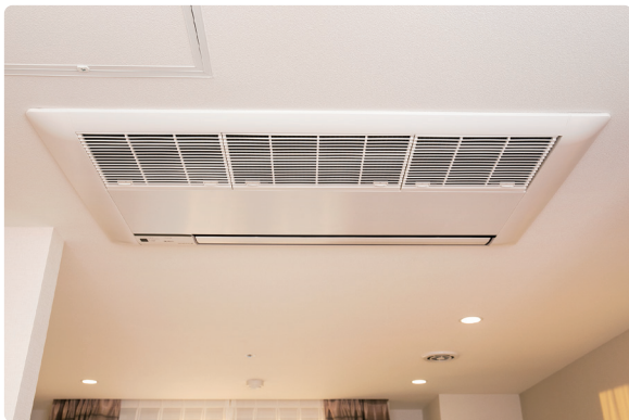
埋め込み式のエアコンとダウンライト