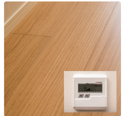
全室に床暖房を完備