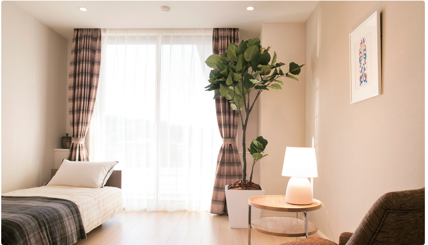
居室 快適性と機能性を重視した居室には、光と風をたっぷり取りこめるハイサッシを採用。壁紙や床材は落ち着いた色調のデザインで3タイプ。