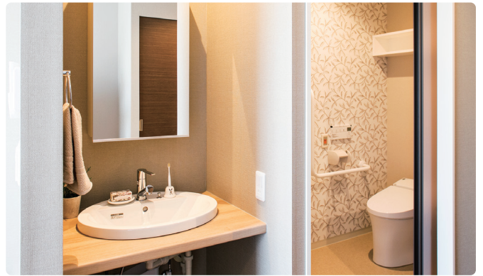
洗面とトイレをセパレートし、清潔感を配慮