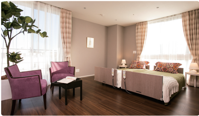
お二人でも入居可能な広めの居室もご用意