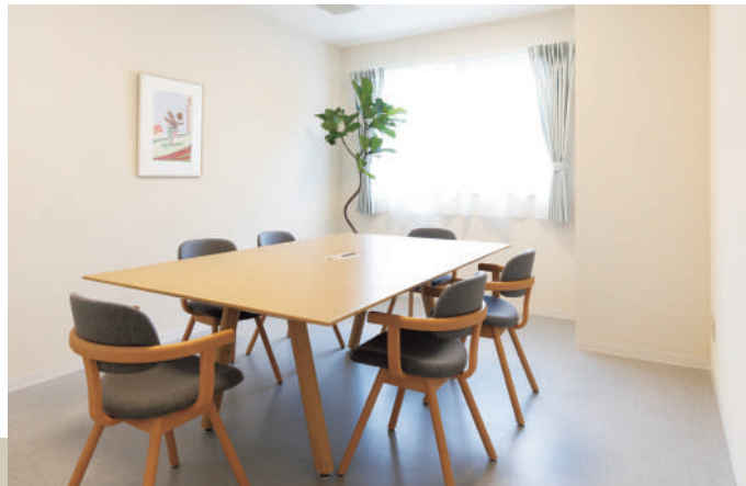
プラチナラウンジ

お身体の状態に合わせて、安心してお使いいただける機械浴室と個浴室を完備しています。