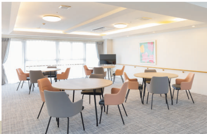
2階プラチナラウンジ

ご家族さまとの団欒にお使いいただける個室をご用意いたしました。ご予約の上、ご自由にお使いいただけます。