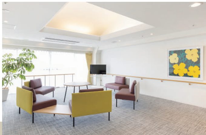
4階プラチナラウンジ

ご自宅のリビングと同じような感覚でご家族様との団欒にもお使いいただけるラウンジをご用意いたしました。