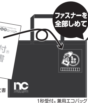
1秒受付® 兼用エコバッグ